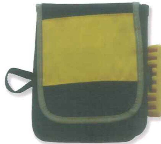
WEIGHT POCKET M

BRUKSANVISNING - USER GUIDE - KÄYTTÖOHJEKIRJA - MANUAL DE USUARIO - BETRIEBSANLEITUNG - BRUKERMANUAL - MANUEL UTILISATION - GEBRUIKSAANWIJZINGEN - MANUALE DI USO E MANUTENZIONE - ИНСТРУКЦІЯ